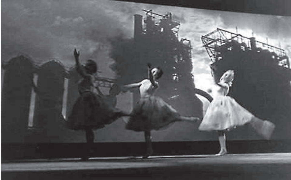
Josef Svoboda, Laterna Magika , 1958