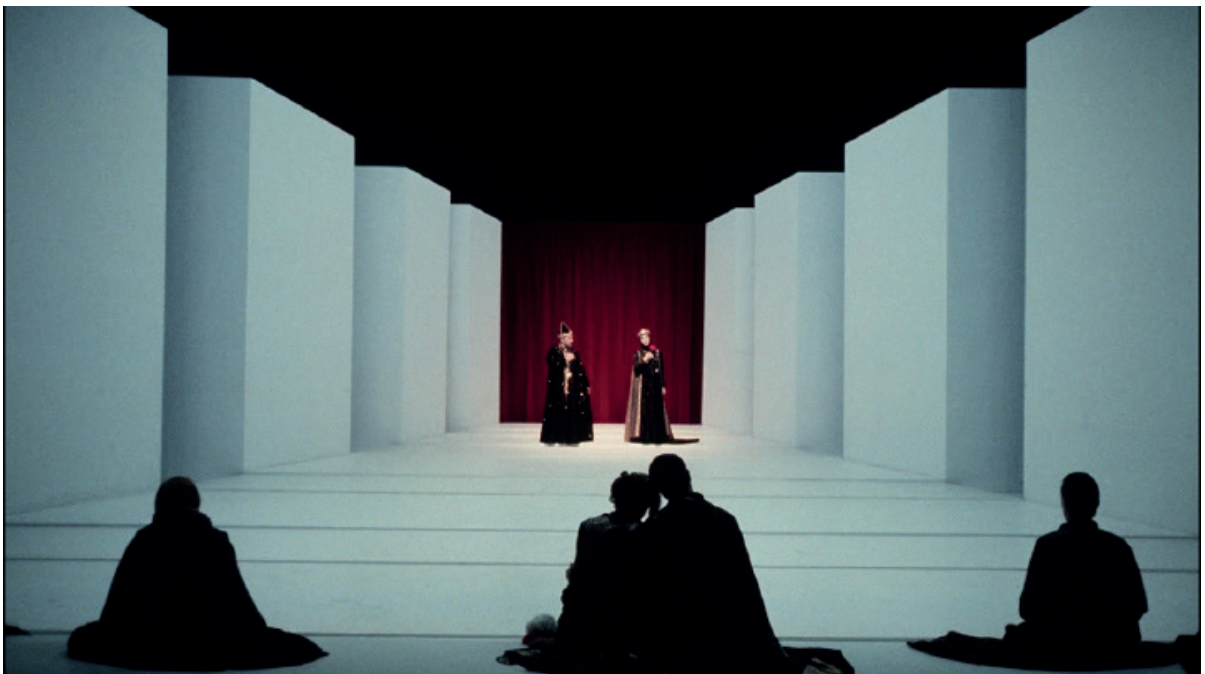
Hamlet mise en scène d'Antoine Vitez - 1983

Par ailleurs, dans son aspect épuré, la scénographie de Pierre Nouvel peut évoquer les travaux d'Adolphe Appia ou Gordon Craig, qui datent du début du XXe siècle...ou encore, dans une semblable sobriété esthétique et géométrique, avec la séparation de l'espace en deux plans, la scénographie de Yannis Kokkos ( Hamlet , 1983, m.sc Antoine Vitez)