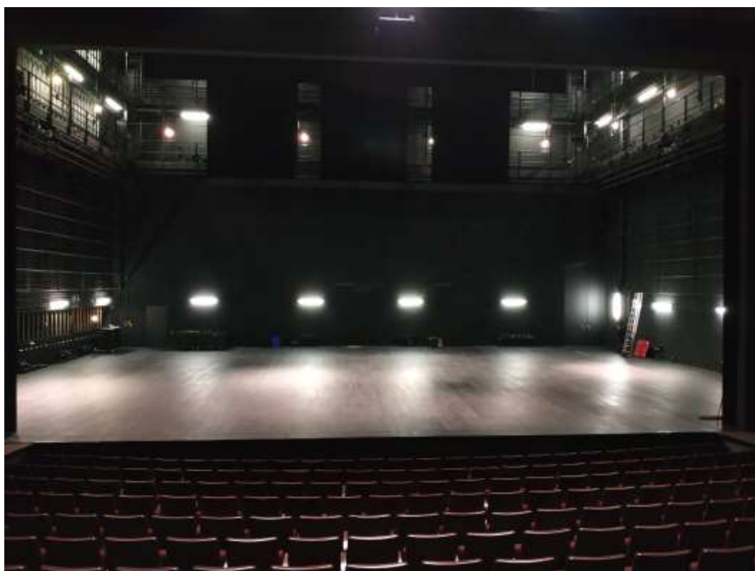
Cage de scène vue depuis la régie