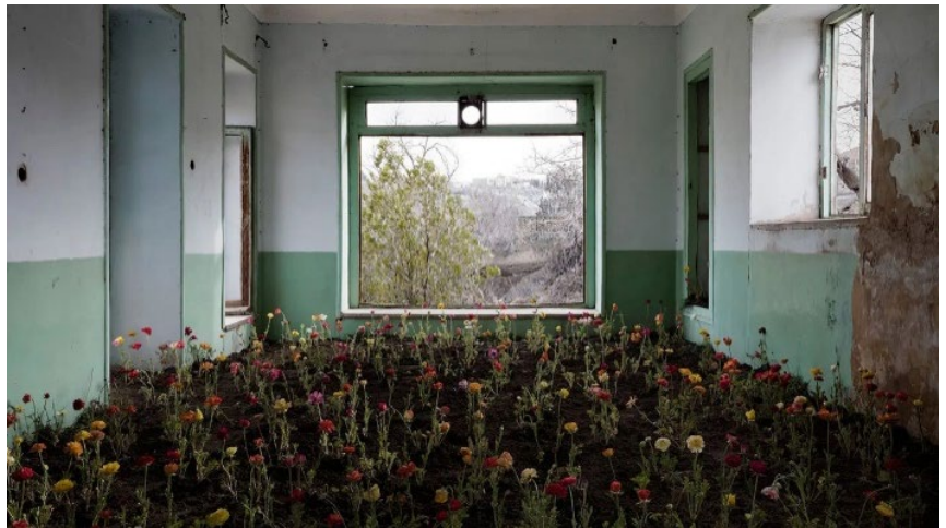
« Home » - Gohar Dashti