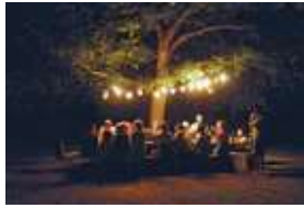
© DES LA PHOTO DES TOUS

Les souvenirs se racontent, les histoires se narrent, les photos vieilles s'échangent tout comme la parole. Remember. Remémorer. Remember ? Autour de la table, artistes, spectateurs et revenants dialoguent et confient les souvenirs des moments de vie, des moments de mort, des moments de deuil qui ont été les leurs. Inspiré du Bonheur des morts - récits de ceux qui restent de Vinciane Despret, Remember explore la place qu'occupent les morts dans la vie des vivants. CR