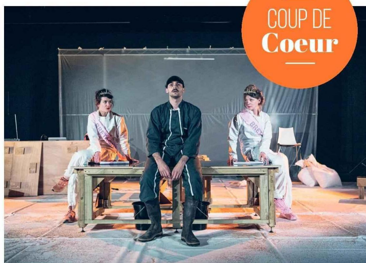
Pig boy, 1986-2358, à l'affiche à La Comète.